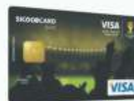
Sicoobcard Visa Gold