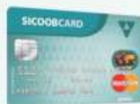
Sicoobcard Mastercard Débito

Os cartões Sicoobcard são modernos, completos e cheios de vantagens para o associado. Um deles combina com você, escolha o seu.