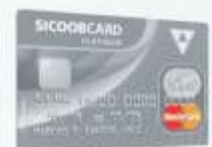
Sicoobcard Mastercard Platinum