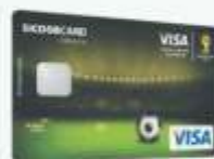
Sicoobcard Visa Clássico