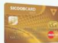
Sicoobcard Mastercard Gold