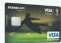
Sicoobcard Visa Platinum

e milhas Azul, no Visa. Quem escolheu os Platinum, marca 1,5 pontos para cada US$ 1 gastos.