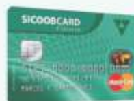
Sicoobcard Mastercard Clássico