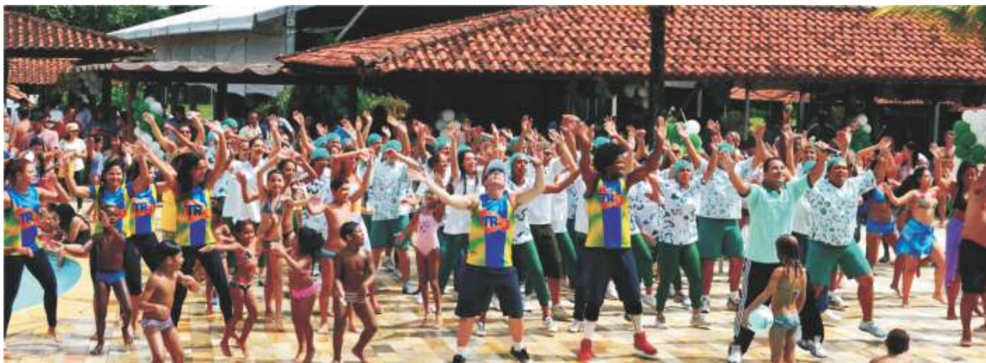
No Rio, mais uma vez teve festa no Lajedo