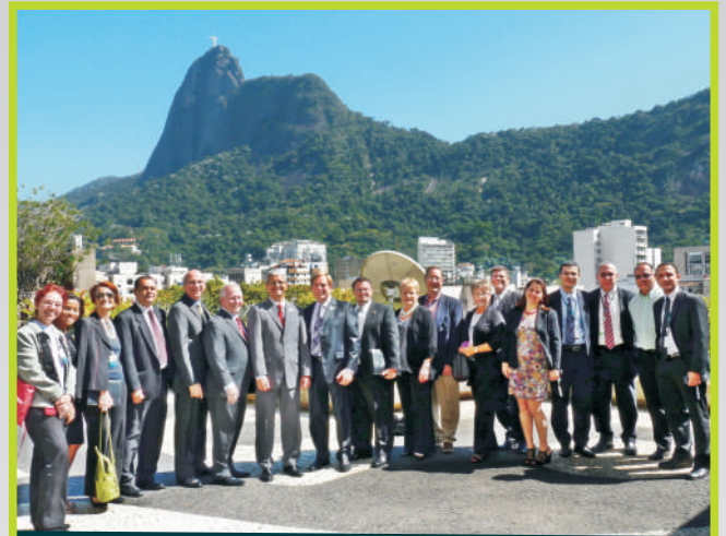
Os visitantes foram recebidos pela Diretoria e Gerentes do Sicoob Cecremef, e por dirigentes do Sicoob Central Rio

Depois os cooperativistas visitaram os diversos setores a agência do Escritório Central de Furnas, a Sede, o Consultório Odontológico e o Centro de Treinamento do Sicoob Cecremef.